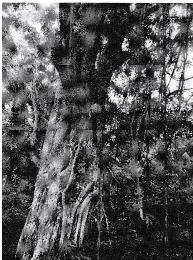
ජායාරූප අංක 3 - මුට්ටි නැමීම සිදුකර ඇති ආකාරය