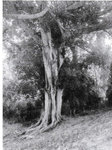
ජායාරූප අංක 2 - සංභිඳු