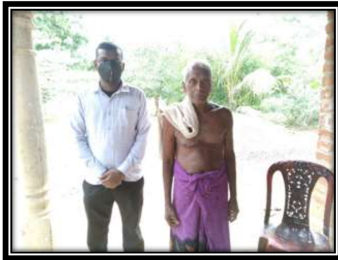
ඡායාරූපය 07 (මහවැවේ විදානේ මුතුබණ්ඩා මහතා සමඟ පැවැත්වුණු සම්මුඛ සාකච්ඡාව)