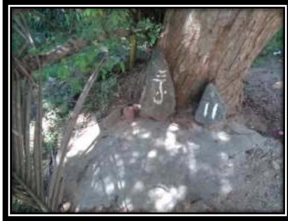
ඡායාරූපය 06 (පාඨිග්ගම පුල්ලෙයාර් වන්දනය)