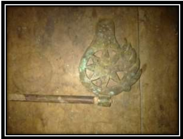
ඡායාරූපය 01: දේව අනාභරණ කට්ටලයට අයත් සිරි කඩුව