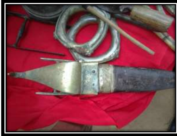
ඡායාරූපය 02: දේව අනාභරණ කට්ටලයට අයත් කාල ජමජාරිය