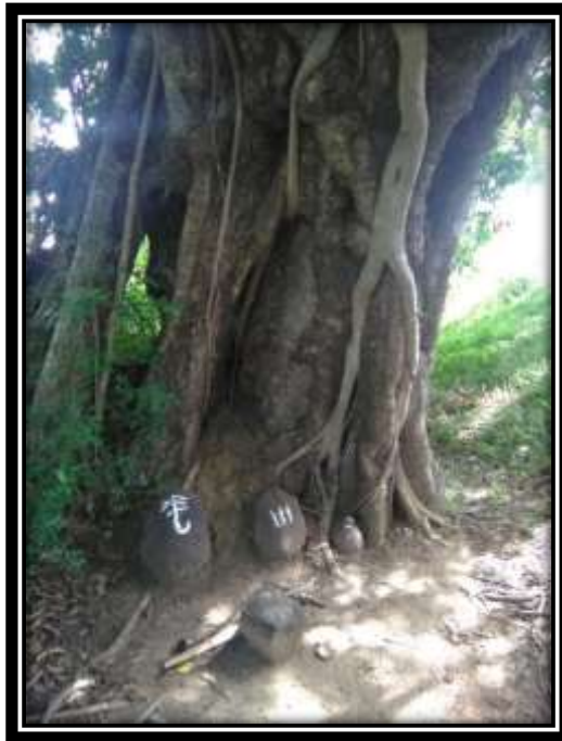
ඡායාරූපය 05 (පාඩිග්ගම පුල්ලොයාර් වන්දනය)