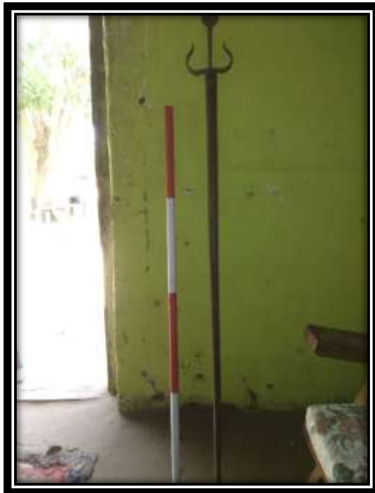
ඡායාරූපය 03: දෙවියන් මායම්වීමේ ශාන්තිකර්මයේ දී භාවිත කරන යෂ්ටිය හෙවත් හෝල් කෝටුව