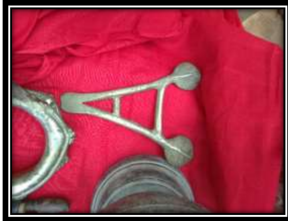
ඡායාරූපය 04 (දේව ආභරණ කට්ටලයට අයත් නයි හත්ත)