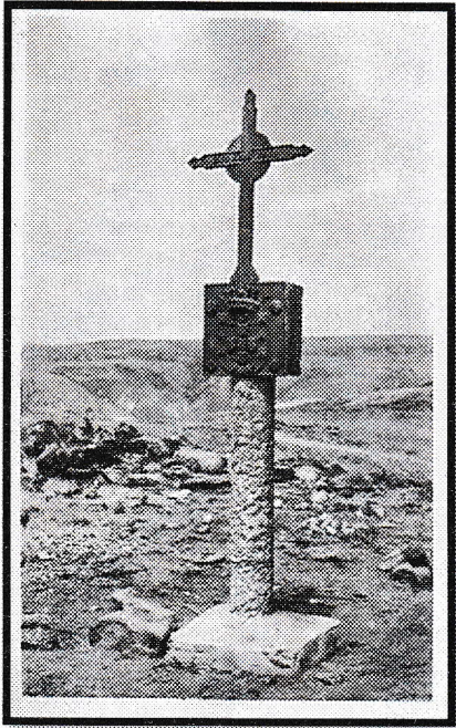
රූප සටහන 3 https://en.wiktionary.org/wiki/padrão

ලංකාවේ පිහිටුවන ලද පෘතුගීසි දේශ ගවේෂණ ස්මාරකය මේ අතරින් දෙ වැනි ගණයට අයත් වුව ද, දේශ ගවේෂණය සඳහා මූලික වූ අයගේ නම් ආදිය ඉන් දැකගත නොහැකිවීම ගැටලු සහගතය. එකී තොරතුරු පැවති කොටස විනාශ වන්නට ඇතැයි හෝ යම් හෙයකින් එම තොරතුරු එහි සටහන් නොකරන්නට ඇතැයි ද යනුවෙන් අනුමාන කළ හැකි ය.