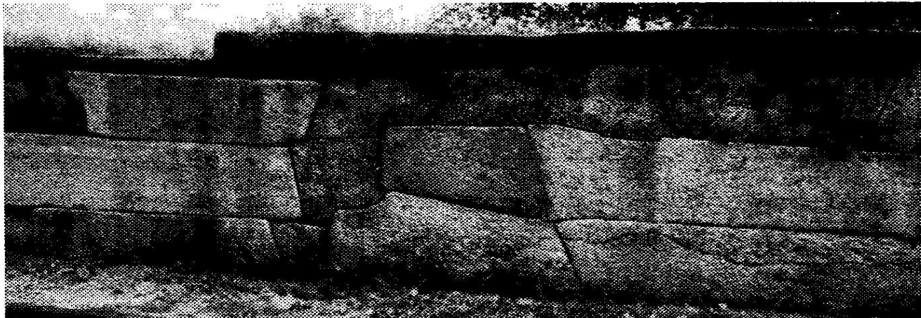
ඡායාරූපය 7: සිමෙන්ති බදාම භාවිතයෙන් උෟණ පූර්ණය කරන ලද ශිලාමය ප්‍රාකාරයක්