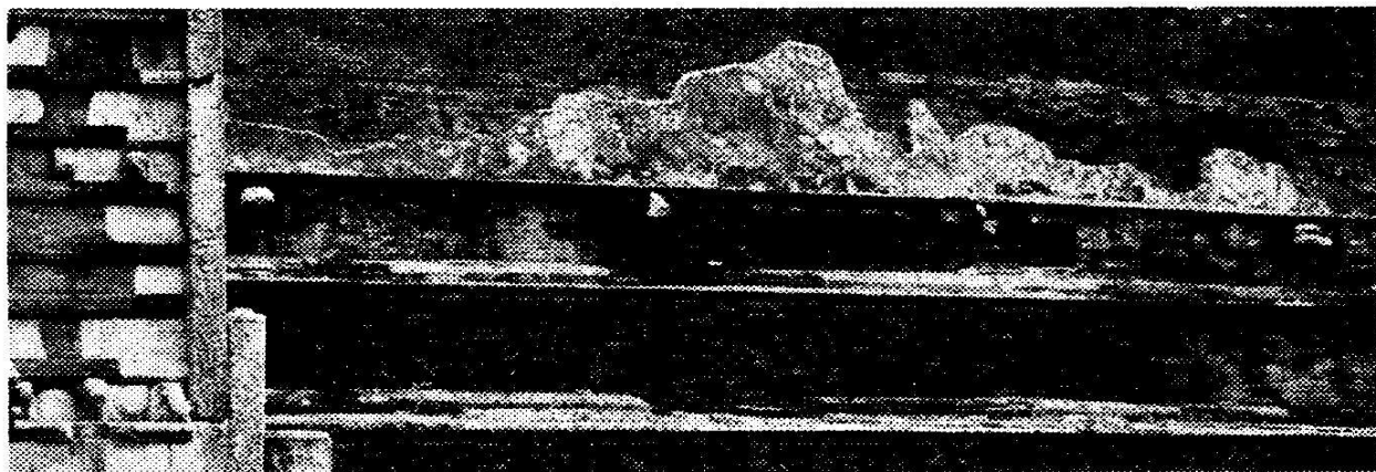
ඡායාරූපය 1: ජේතවන ස්තූපයේ තෙවන පේසාව මත ඇති පැරණි බදාම කොටස්

යනුවෙන් වන සඳහන සම්බන්ධයෙන් ද මහා ස්තූප සංරක්ෂණයේ දී අවධානයට පාත්‍රව තිබේ. මෙම ස්තූප කිසිවක් පෞද්ගලික ස්මාරක නොවේ. එහෙයින් ඒවා සංරක්ෂණය කිරීමේ පරමාර්ථය හුදෙක් සමාජමය වැඩදායී අරමුණක් ම වෙයි. නමුත් ඒවායේ මුල් ස්වරූපය ආරක්ෂා කිරීම හෝ ස්මාරකයේ අලංකාර සැරසිලි ආදිය වෙනස් නොකිරීම සම්බන්ධයෙන් සැලකිලිමත් වූ බවක් ඇතැම් ස්මාරක දෙස විමර්ශනයේ දී හඳුනා ගත හැකි ය. විශේෂයෙන් රුවන්වැලිය හා මිරිසවැටිය ස්තූප සංරක්ෂණයේ දී විද්‍යාත්මක දැනුම හෝ පුරාවිද්‍යාත්මක නිර්ණායක නිසි පරිදි භාවිතයට ගැනීමක් සිදු නොකරන ලද බැවින් එම ස්මාරක දෙකින් ම ඉහත අපේක්ෂාවන් ඉටු වී නොමැති බවක් පෙනේ. නමුත්, සෙසු ස්මාරක ද්වය එම ලක්ෂණ ආරක්ෂා කර ගනිමින් සේම යම් යම් වෙසනස්කම් ද සිදු කරමින් සංරක්ෂණ කටයුතු දියත් කර තිබේ. අභයගිරිය හා ජේතවනය යන ස්තූප දෙකෙහිම හතරැස් කොටුවේ මධ්‍ය වක්‍රය පැරණි ස්වරූපයෙන්ම ආරක්ෂා කර ගැනීමට කටයුතු කිරීම, ආයකවල අස්ථානගතව ඇති කොටස් වෙනුවට ගඩොල් මඟින් මැදිහත්වීම් සිදුකර සම්පූර්ණ කිරීම, පිටත ප්‍රාකාරයේ බිත්තිවල ගලින් කළ කොටස් නොමැති තැන ගඩොලින් උගුණපූර්ණයන් සිදු කිරීම ආදිය මේ අයුරින් සිදු කරන ලද මැදිහත්වීම් ලෙස පෙන්වා දිය හැකි ය.