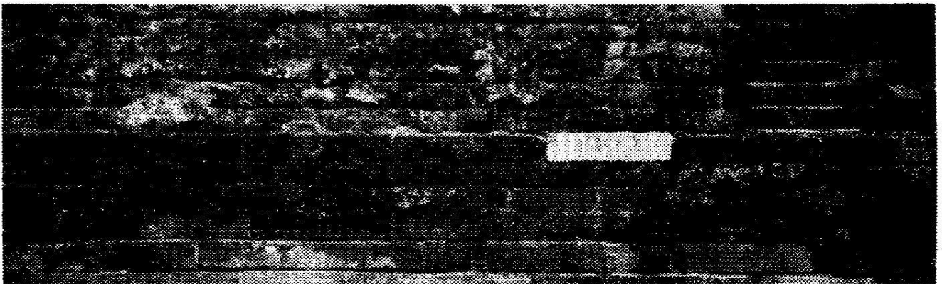
ඡායාරූපය 3: සංරක්ෂණ කාර්යයේ දී දිනගල් යෙදීම

ස්මාරකයක අඛණ්ඩ කොටස් වන කැටයම්ල විත්ත හෝ අලංකාර සැරසිලි ඒවායේ ආරක්ෂාව සඳහා පමණක් නොවන්නට ඉවත් කිරීමට කිසිසේත් ඉඩ නොතැබිය යුතු ය ( Items of sculpture, painting or decoration which form an integral part of a monument may only be removed from it if this is the sole means of ensuring their preservation - Article 8 ). මෙබඳු ඉවත්කිරීම් කිහිපයක්ම අභයගිරි හා ජේතවන ස්තූප ආශ්‍රයෙන් හඳුනා ගත හැකි ය. එසේ ආයතනවල තිබූ සිතුවම් කොටස් සහිත සෙල් පුවරු මෙන්ම ස්ථානීයව ස්ථාපිත කළ නොහැකි වූ ආයතනවල කැටයම් රූ එලක කොටස් එම ව්‍යාපෘතීන්හි කෞතුකාගාරවල ප්‍රදර්ශනයෙහි තබා ඇත. ස්මාරක සම්බන්ධයෙන් ප්‍රතිසංස්කරණ කටයුතු දියත් කිරීමේ දී එය ඉහළ