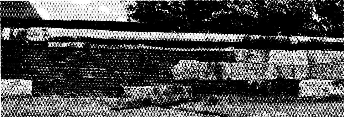
ඡායාරූපය 6: ගඩොල්වලින් උෟණ පූර්ණය කරන ලද ජේතවනයේ ශිලාමය ප්‍රාකාරයක්

ස්මාරක සංරක්ෂණයේ දී අවධානය යොමු කරන තවත් කේන්ද්‍රයක් නම්, ආදේශක එකතු කිරීමේ නිර්ණායකයි. ආදේශක එකතු කිරීමේ දී ඒවා ස්කන්ධයට මනාව ගැලපිය යුතු යන නව හා පැරණි කොටස් වෙන් කොට හඳුනා ගැනීමේ හැකියාව ද පැවතිය යුතු වේග මේ ප්‍රතිසංස්කරණ මඟින් ස්මාරකයේ ඓතිහාසික හෝ කලාත්මක සාධක කිසි විටෙකත් ව්‍යාජව පෙන්වුම් නොකළ යුතු ය ( Replacements of missing parts must integrate harmoniously with the whole, but at the same time must be distinguishable from the original so that restoration does not falsify the artistic or historic evidence - Article 12 ) යන්නයි. මාතෘකානුගත ස්තූප සම්බන්ධයෙන් අවධානය යොමු කිරීමේ දී ගඩොල් බිත්ති බැඳීමේ දී නව ගඩොල් භාවිතයත්, ශිලාමය කොටස් වෙනුවට බදාමයෙන් තනන ලද ආකෘති ඉදිරිපත්