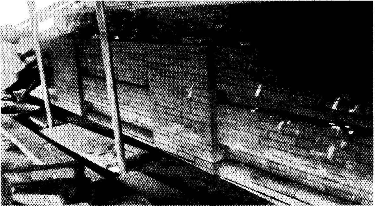
ඡායාරූපය 2: ජේතවන ස්තූපයේ හතරැස් කොටුවේ සංරක්ෂණ කටයුතු