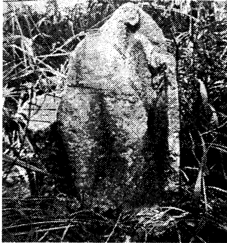
හිටි බුදු පිළිම වහන්සේ (ජායාරූප- 6)

හිටි පිළිමය ද නිර්මාණය කර තිබෙන්නට ඇති බව සිතිය හැකි ය.