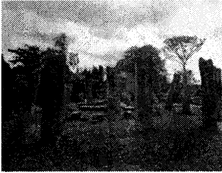
පොහොය ගෙය (ජායාරූප-3)

ගොඩනැගිල්ලක් ලෙස නිර්මාණය කර තිබුණු බව සිට වූ ගල් කණුවල අග ඇති ලී දඬු රැදවීමට කපන ලද කන්කු ලක්ෂණ මගින් නිගමනය කර ඇත. උසින් මීටර් 3ක් ද පළලින් සෙ.මී.70 පමණ වූ ද මෙම ගල් කුලුණු දැඩි බවින් හා රළු බවින් යුක්ත ය. දැනට වල්බිහිව ඇති මෙම ගොඩනැගිල්ලේ ගල් කණු දෙකක මතුපිට ශිලා ලේඛන දෙකක් දැක ගත හැකි ය. මේ හැර තවත් කුළුණු දෙකක ජ්‍යාමිතික හැඩයක් සහ ඊතලයකට සමාන රූපයක් දක්නට ලැබේ. මේවා මෙම ගල් කුළුණු සැකසීමට දායකත්වය සපයන පුද්ගලයින්ගේ හෝ ගෝත්‍ර සංකේත විය හැකි බව හෙට්ටිආරච්චි මහතා ප්‍රකාශ කර ඇත (හෙට්ටිආරච්චි 2013: 26). ලෝවාමහා ප්‍රාසාද පොහොය ගෙය, රත්නප්‍රාසාද මෙන්ම සිතුල්පව්ව ආදී පැරණි සෑම විහාරයකම පාහේ මෙබඳු පොහොය ගෙවල් සාධක හමු වී ඇත. පුවරසන්කුලම පොහොයගෙය ශිලා ලේඛන සාධක අනුව ක්‍රි.ව. 1 වැනි සියවස නියෝජනය කරන අතර සමකාලීන වශයෙන් මෙය විශාල ඉදිකිරීමක් බව නටබුන් තුළින් සාධක සැපයිය හැකි ය.