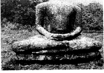
හිඳි බුද්ධ ප්‍රතිමා වහන්සේ (ඡායාරූප-5)

පුවරසන්කලම විහාර භූමියෙහි දැනට විනාශ වී ගිය බුදු පිළිම සාධක දැකගත හැකි ය. මෙයින් දෙකක් හිඳි පිළිම ගණයට අයත්වන අතර එකක් හිටි පිළිම ගණයට අයත් වේ. මෙම භූමියේ තැන්පත් ව තිබූ ගලින් නිම කරන ලද හිඳි බුදු පිළිම දෙකක් අනුරාධපුර කෞතුකාගාරයේ ප්‍රදර්ශනයට තබා ඇත. ස්තූපයට බටහිර දෙසින් ඇති ගල් පර්වතයක් මත සමාධි මුද්‍රාවෙන් නිර්මාණය කරන ලද ප්‍රතිමාවක් දැකගත හැකි ය. හිස සුන් වූ සමාධි ප්‍රතිමාව සෙ.මී. 96 උසය. මෙම පිළිමයේ විවරය ඒකාංශ ව පොරවා තිබේ. වම් අත්ල මත දකුණු අත්ල තබා පිහිටුවීමෙන් සමාධි මුද්‍රාව නිරූපනය කරයි. එසේ ම වම් පාදය මත දකුණු පාදය පිහිටුවීමෙන් චීරාසනය ප්‍රකට කරයි. පිළිම වහන්සේ හිඳුවා ඇත්තේ අඟල් 6ක් පමණ ඝණකමින් යුතු ඵලකයක් මත ය. අනුරාධපුර යුගයේ හිඳි පිළිම සඳහා භාවිතා කරන ලද පොදු සම්ප්‍රදායට මෙම පිළිමය නිර්මාණය කර ඇත. 1895 වර්ෂයේ පුරාවිද්‍යා දෙපාර්තමේන්තුව විසින් මෙම පිළිමය වාර්තා කළ බවට තොරතුරු ලැබී ඇත (හෙට්ටිආරච්චි 2013:33).