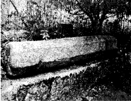
යුප ගල (ජායාරූප 2)

ගමන් මාර්ගය මෙසේ ගල් පඩි යොදා නිමකර ඇති බව පෙනේ.