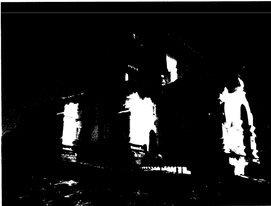
ඡායාරූපය 07. උඩුනුවර ලංකාතිලක රජමහා විහාරය