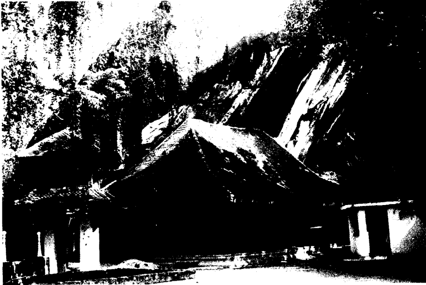
ඡායාරූපය 02. හිඳගල රජමහා විහාරය