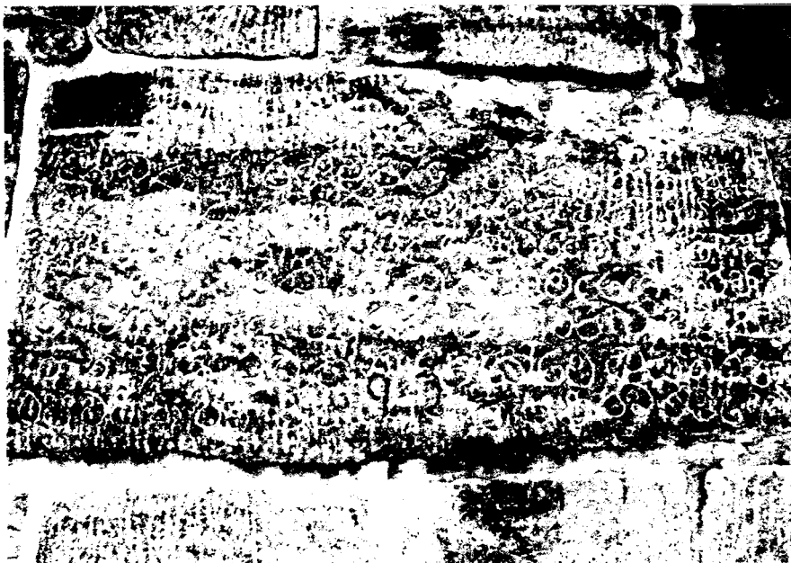
ඡායාරූපය 03. මහනුවර නාථ දේවාල ශිලා ලිපිය