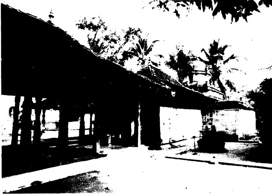
ඡායාරූපය 06. මහනුවර නාථ දේවාලය