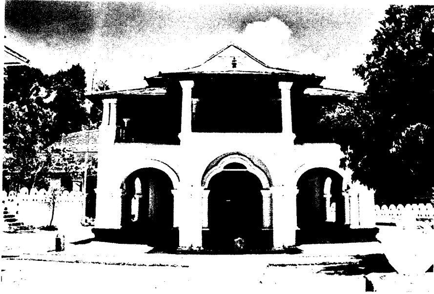
ඡායාරූපය 08. මහනුවර පෝය මළ විහාරය