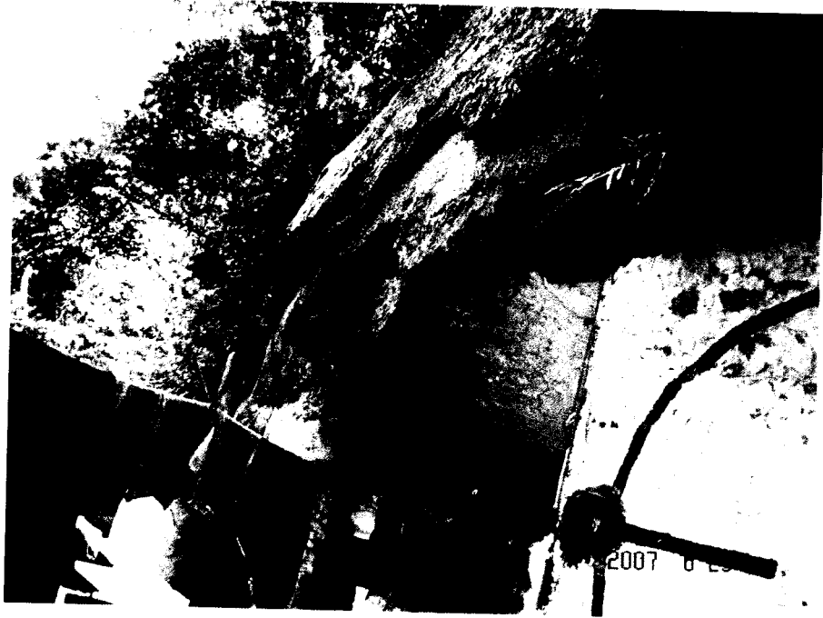
ඡායාරූපය 04. මහනුවර උඩවත්තකැලේ කටාර කෙටු පැරණි ගල් ගුහාවක්