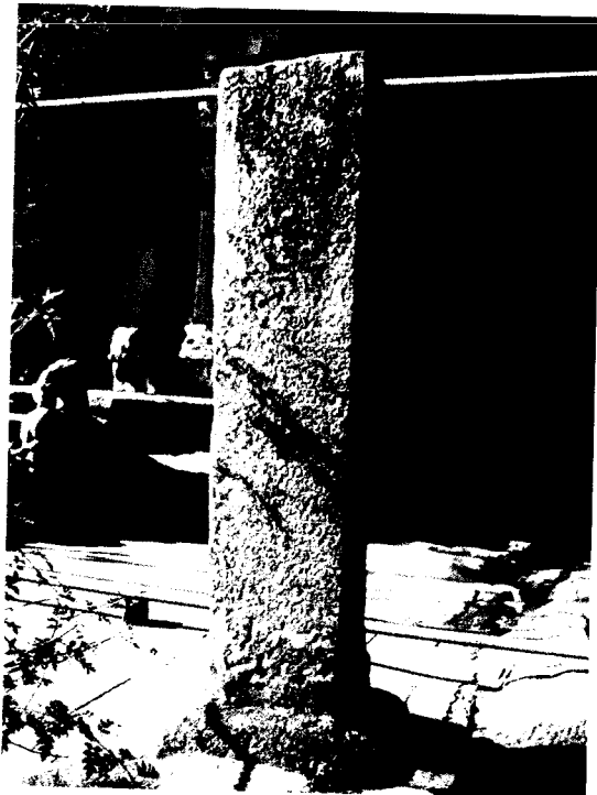
ඡායාරූපය 05. ගඩලාදෙණිය රජමහා විහාර සුවරු ලිපිය