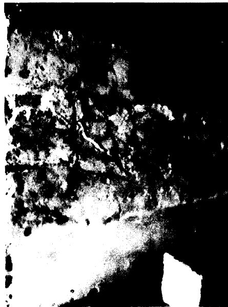
ඡායාරූප අංක 03 වම 'න බිත්තියේ සිතුවම