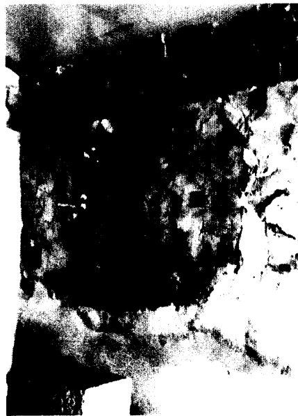
ඡායාරූප අංක 04 ධාතුගර්භයේ දකුණ 'න බිත්තියේ සිතුවම