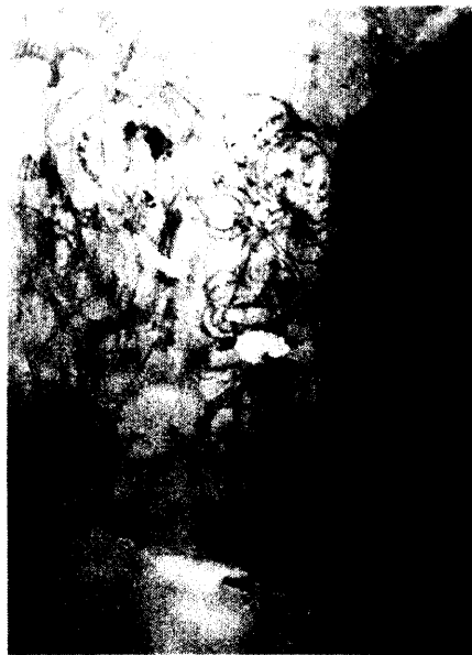
ඡායාරූප අංක 02 ධාතුගර්භයේ ඇතුළත බිත්තියේ සිතුවම