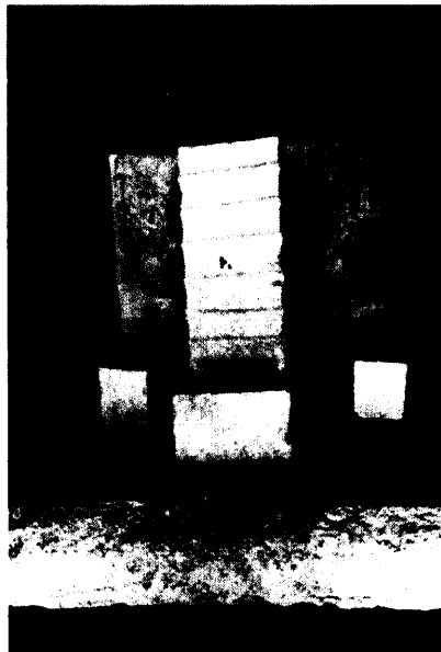
ඡායාරූප අංක 01 ධාතුගර්භය හා මහාමේරු ආකෘතිය