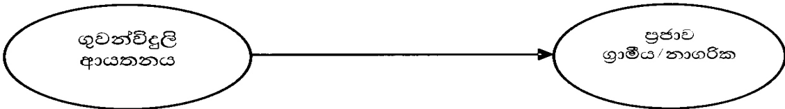
මාධ්‍යය හා ප්‍රජාව අතර වන ඒකපාර්ශවීය සන්නිවේදනය

නමුත්, යථාර්ථවත් සංවර්ධන සන්නිවේදන ක්‍රියාවලියක් නම්, යම් මාධ්‍ය කාර්යයක් හා සම්බන්ධතා දැක්විය යුතු ආයතන ගණනින් බොහෝ ය. ඒවා ස්වභාවයෙන් ම මාධ්‍යය හා අන්තර් සම්බන්ධතා පවත්වා ගත යුතු ය.